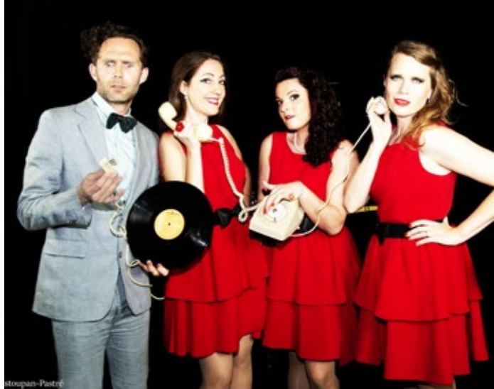
CHANSON / HUMOUR