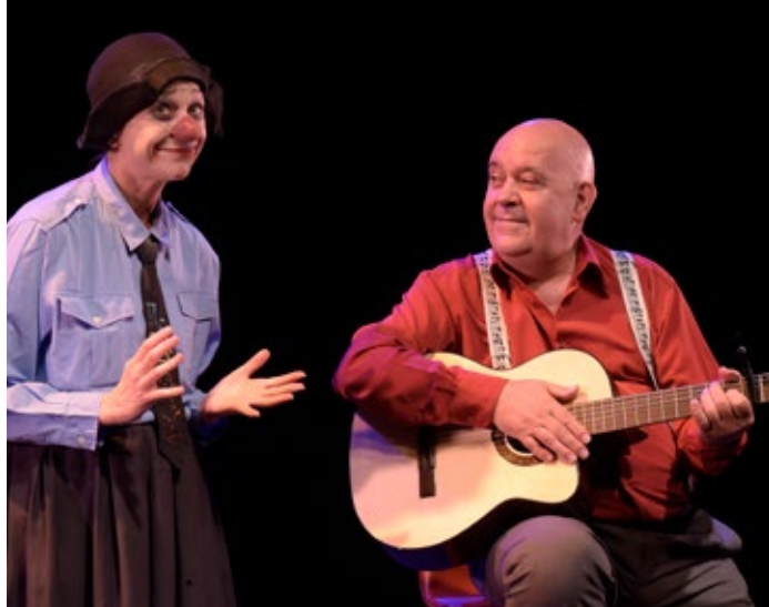
CHANSON / HUMOUR