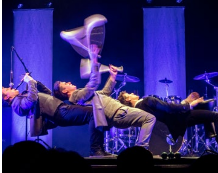
PERCUSSIONS / JONGLAGE